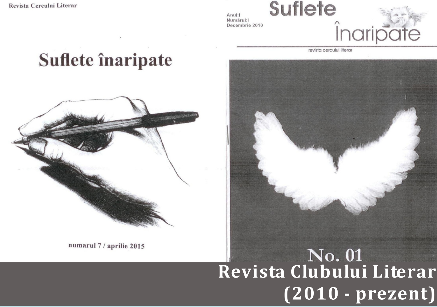
No. 01 Revista Clubului Literar (2010 - prezent)

“...am senzația că “prind aripi” și am început din nou să cred în mine și în oameni...”