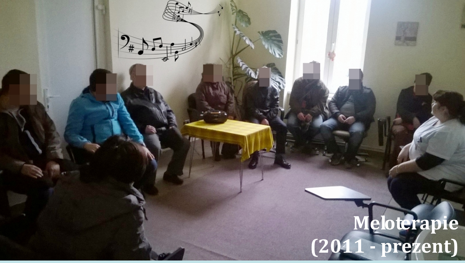
Meloterapie (2011 - prezent)

“...aici pot să mă relaxez și să mă simt liniștit...”