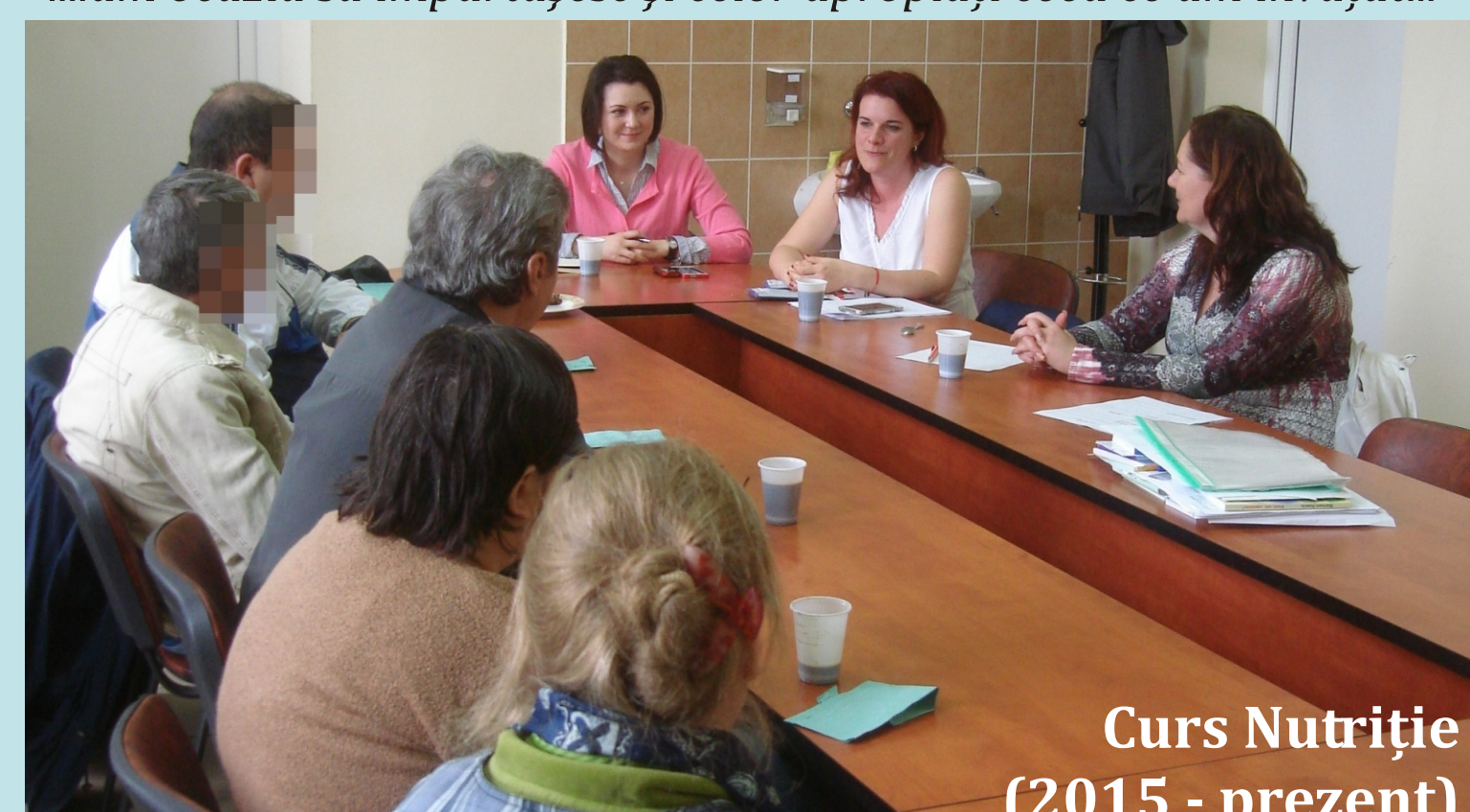
Curs Nutriție (2015 - prezent)

“...învăț cum să mă hrănesc sănătos...” “...am ocazia să împărtășesc și celor apropiați ceea ce am învățat...”