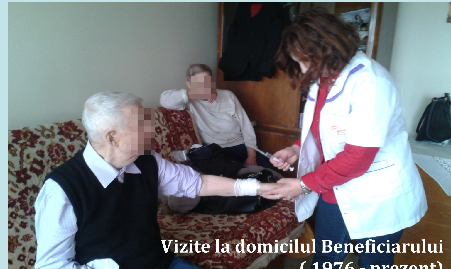
Vizite la domiciliu Beneficiarului (1976 - prezent)

“... mă simt îngrijit și protejat...” “...sunt încântat că cineva se interesează de starea mea de sănătate...”