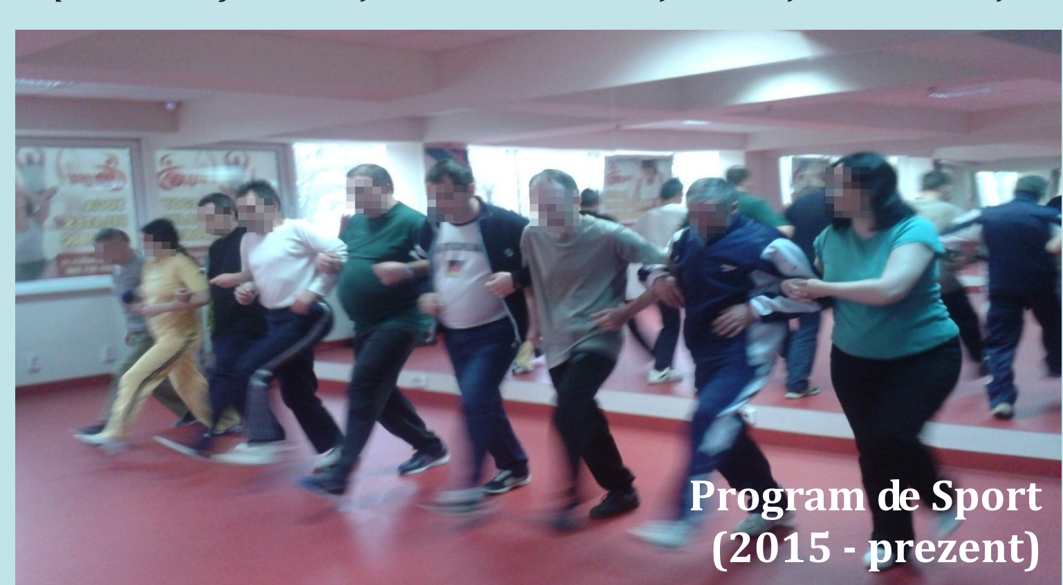
Program de Sport (2015 - prezent)

“...îmi aduce zîmbetul pe buze...” “...sportul ne ajută să ieșim din rutina bolii și să simțim ritmul vieții...”