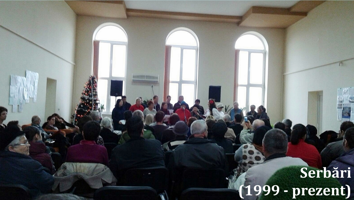
Serbări (1999 - prezent)

“...așa simt și eu sărbătorile...” “...mă simt egal cu cei care mă au în grijă...”