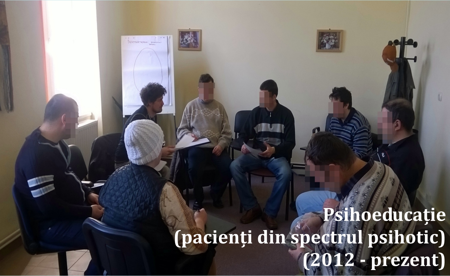
Psihoeucație (pacienți din spectrul psihotic) (2012 - prezent)

“...mă simt bucurios când mă întâlnesc cu colegii de grup...” “...am întâlnit bolnavi ca mine, și așa am început să-mi înțeleg boala...”