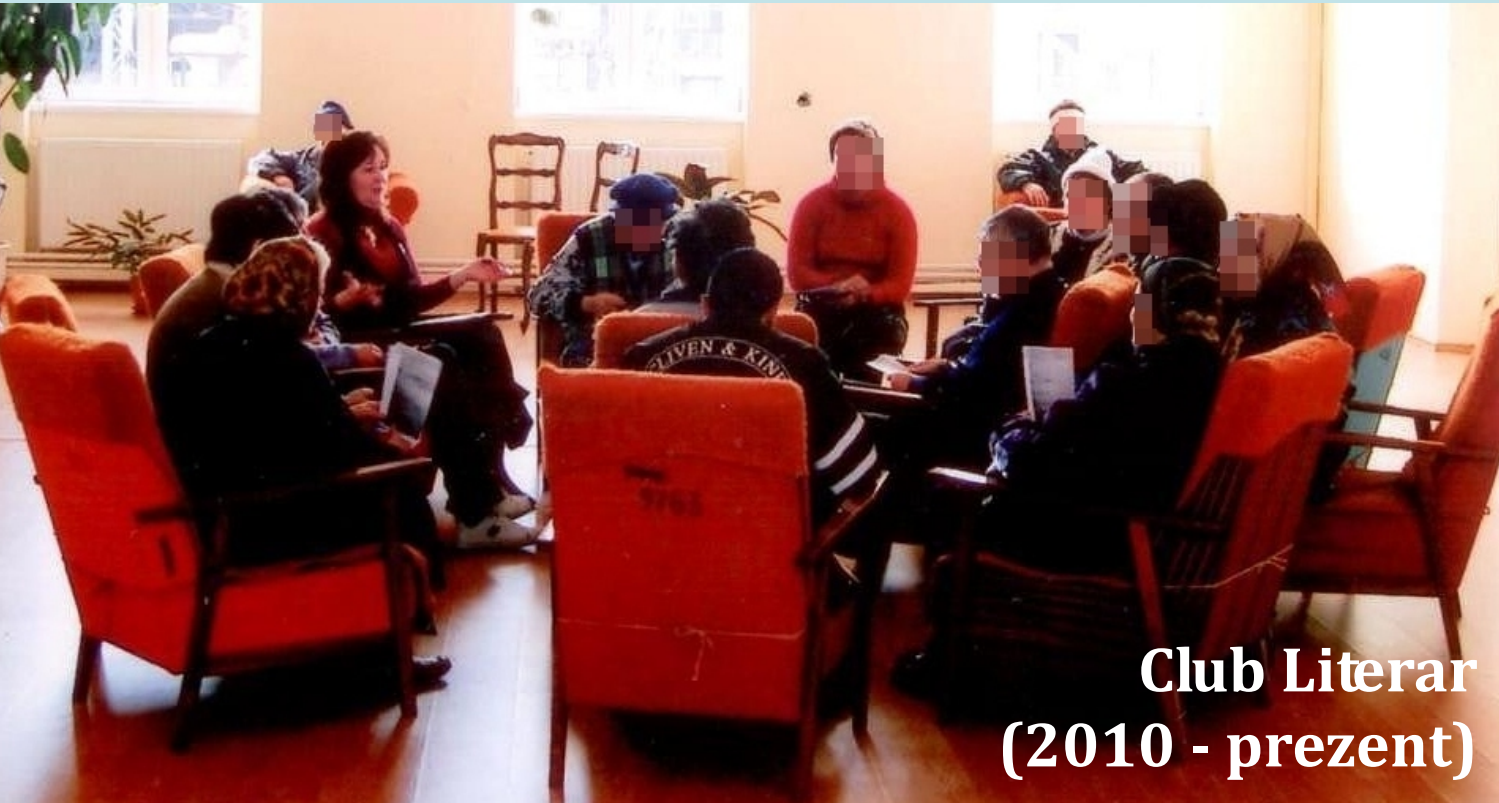
Club Literar (2010 - prezent)

“...mă simt bine când mă întâlnesc cu prietenii de la grup...” “...aici pot lega noi prietenii...”