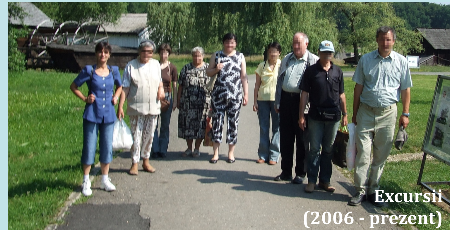
Excursii (2006 - prezent)

“... aici am ocazia să mă simt liber și încrezător...” “... am sentimentul că toată lumea este a mea...”